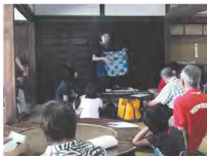
▲心を豊かにする「生きがい分野」

小学生以上で市内に在住、通勤、通学しているかたなら誰でも講座を受けることができます。(年会費、入会金あり)