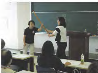
▲健康を考える「健康福祉分野」