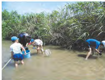
▲豊かな自然を感じる「環境分野」