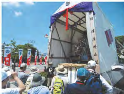
▲歴史や文化に触れる「ふるさと分野」

福津の「ひと」「もの」「こと」を生かした内容となっており、郷土の魅力に触れながら楽しく学ぶことができます。