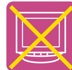
ディスプレイ(ブラウン管・液晶式)