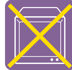
テレビ(ブラウン管式)