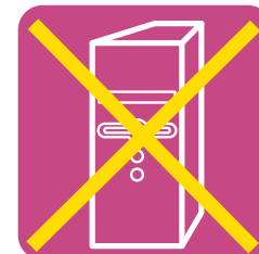
デスクトップパソコン本体