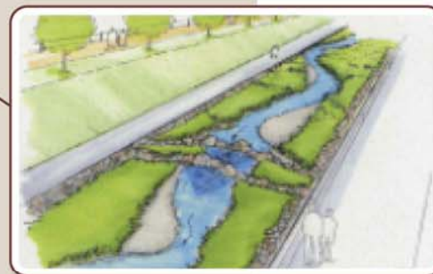
多自然型河川改修イメージ