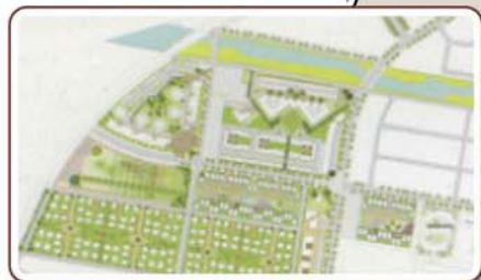
計画建設用イメージ