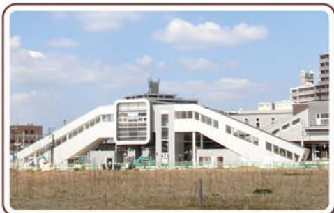
JR福間駅さいごう口