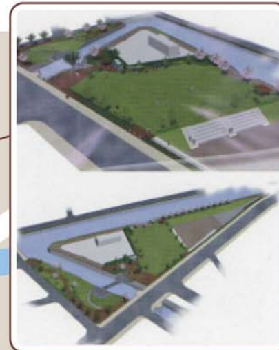
川の駅(親水公園)イメージ